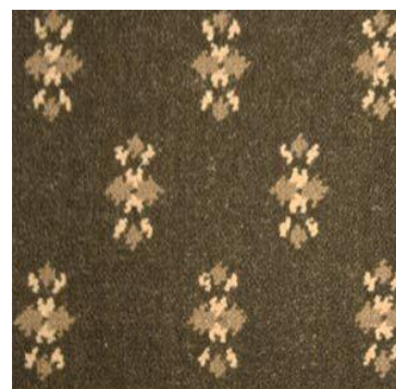
COFFEE BEAN BROWN

Moquette tissage axminster à dessin multidirectionnel Merlin - Raccord 15.24cm x 11.43cm -10 coloris de stock